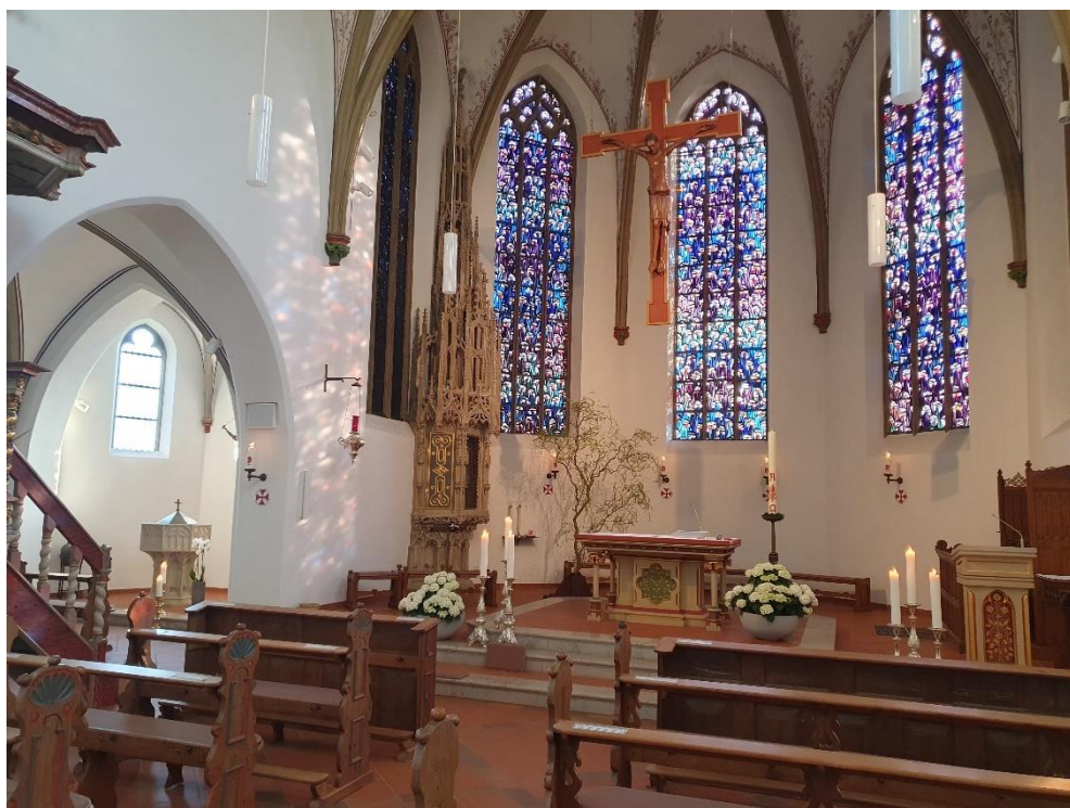
St. Martinus in Benninghausen